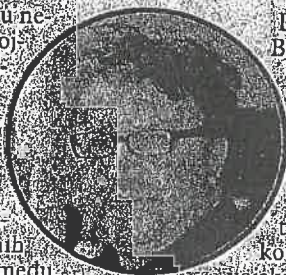
GARIBIJA Manja tekija

Tako je ovaj mali lokalitet privukao veliki broj pobožnih mučenika, ljudi, sufijski, koji su među bostarićima podigli svoje kuće.