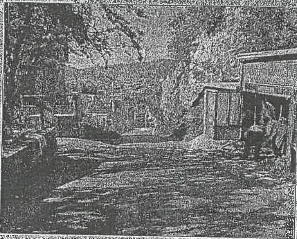
Prostor Bostarića kroz historiju bio je strateški bitan

Sam Boguševac nije bio naseljen, čak je i u vrijeme Jugoslavije tu bilo tek nekoliko kućica. No, ova tekija je privukla i nadahnula hadži